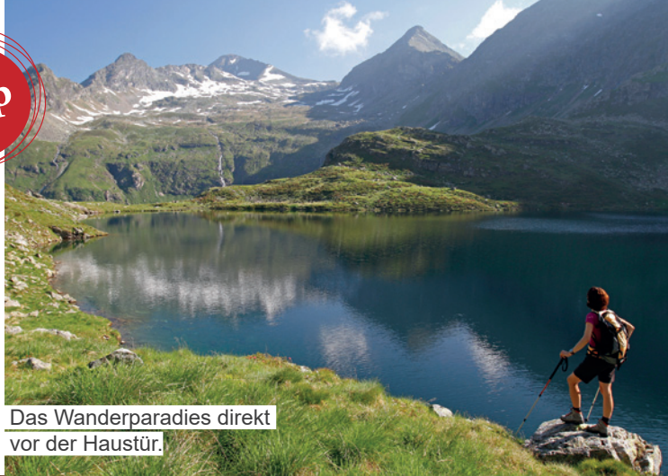
Das Wanderparadies direkt vor der Haustür.

Fünf urig-moderne Ferienhäuser für je 2-5 Personen und ein Original Steirisches Bauernhaus für bis zu 12 Personen sind ganzjährig der ideale Ausgangspunkt für einen Aktivurlaub in der Schladming-Dachstein Region.