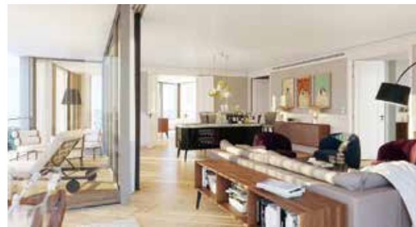
— Stilvoll übernachten: entweder im neuen Andaz Vienna (r.) am Belvedere oder im Max Brown (u.)

„Ob südlich oder nördlich der Donau, am Welterbesteig Wachau lässt sich die einzigartige Landschaft hautnah erleben. Atemberaubend der Blick von der Wachauterrasse des Naturparkhauses Jauerling ins Donautal hinunter . Geschichtstrüchtige Mauern erkundet man bei der Ruine Hinterhaus in Spitz oder in den wunderschönen Räumlichkeiten des Schifffahrtsmuseums . Überquert man die Donau auf der Spitzer Fähre , unbedingt die Camera obscura (von Olafur Eliasson) nicht verpassen . Flussabwärts bewundert man den frisch restaurierten Mauterner Altar in der Schlosskapelle , flussaufwärts entspannt man im Meditationsgarten der Kartause Aggsbach .“