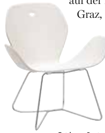
— Zeitloses Design aus Graz: ergonomisch geformter Viteo-Dove -Loungesessel (l.), stapelbare Doppelwand-Kaffeegläser von Mandahorn (r.) und elegante AVO-Leuchte von Grüne Erde (o. r.)