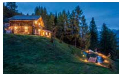
— Erholung pur: etwa in den edlen Chalets vom Landgut Moserhof (l.) oder uriger Chic in den Ferienhäusern Gerhart (o.).

probiert die Seilgleitflugganlage am Stoderzinken. landgut-moserhof.at , gerhart.at