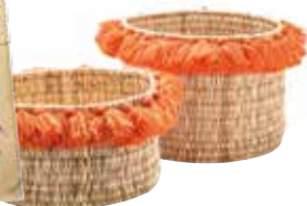
— Kunterbunt: frühlingshafter Kimono von l'Adresse (l.) und süße Körbchen von Silvia Gattin